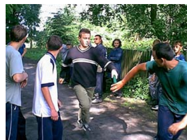
zawody sportowe w gimnazjum