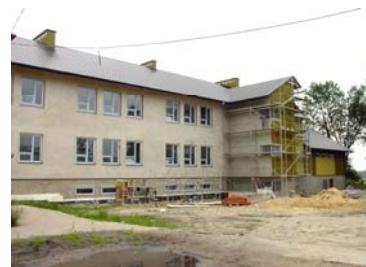
widok od strony placu szkolnego

z budowy Gimnazjum w Ciepeliowie 19 czerwca 2002r. godz.12 00