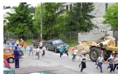
bieg uliczny zorganizowany przez PSP w Ciepeliowie

w placówkach oświatowych naszej gminy zorganizowano zawody sportowe oraz okolicznościowe szkolne festyny.