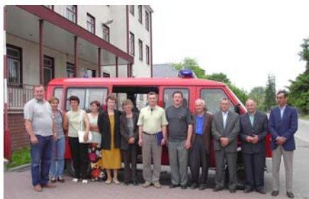
Grupa sołtysów naszej gminy przed wyjazdem na Pielgrzymkę, obok już na miejscu w Licheniu.