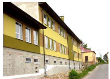
widok od strony drogi na Świesielce