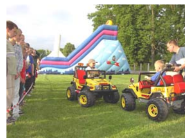
przygotowano wiele atrakcji dla dzieci